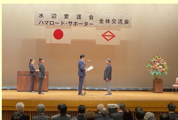
市長による表彰状授与