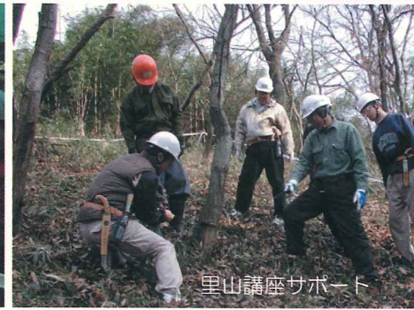
里山講座サポート