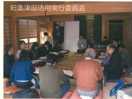
旧奥津邸活用実行委員会