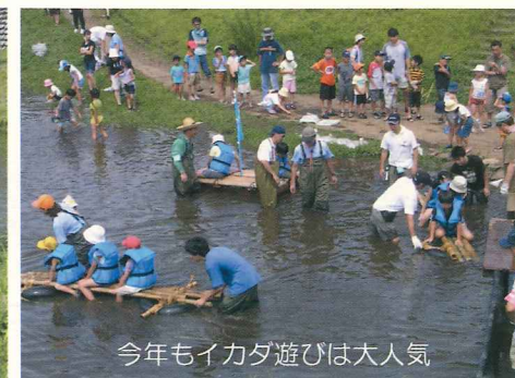
今年もイカダ遊びは大人気

旧奥津邸活用実行委員会のご紹介 横浜市に寄贈された「旧奥津邸」の活用策を検討する会議を、平成15年8月から公募による参加者と地域の関係団体の代表者により行ってきました。平成16年4月からは、アイデアを実行に移していこう、という思いを含め、「旧奥津邸活用実行委員会」となりました。「旧奥津邸」をさらに魅力的な場所にするための活動を展開していきます。連絡先：西部公園緑地事務所 TEL 351-5024