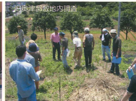
旧奥津邸敷地内調査