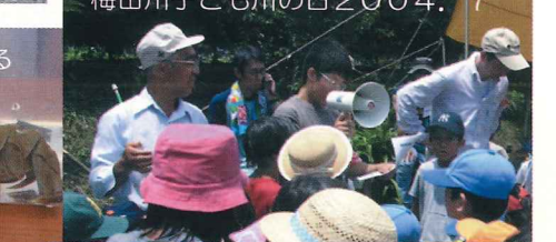
梅田川子ども川の日2004.7