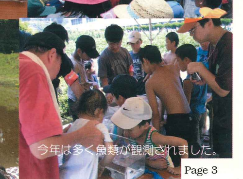
今年は多く魚類が観測されました。