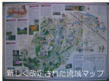
新しく改定された流域マップ

編集後記 久しぶりの新聞の発行で大変お待たせしました。梅田川を取り巻く環境はここ数年大きく変わってきています。環境面では水田保全ボランティアのみなさんのおかげで今年の6月には例年になく多くのホタルが観察できました。とても感動的でした。また、市民の森愛護会のみなさんの努力によって森が明るくなり、山野草が多く見られるようになりました。しかし、盗掘も多くなりヤマユリが急に見られなくなりました。また、3年前から始まっている三保町の宅地開発で多くの森が無くなり、私が小学校の頃、通学路にしていた天神山（昔、カブトムシがいっぱいとれた雑木林）の道が無くなってしまいました。したがって梅田川流域マップも書き換えなくてはなりません。とても悲しいことです。明るいニュースとして水