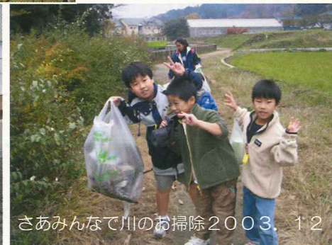
さあみんなで川のお掃除2003.12