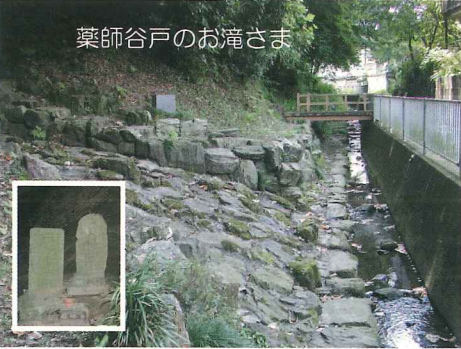
薬師谷戸のお滝さま

(筆者より年上の方はこの方だけ)に聞いたが由来なんて聞いたこと も考えたこともない、知らないという。別な日に小学校の裏から堰跡 へ対岸の山裾(用水路の通っていたあたり)を観察しながら歩いてい いた時、堰から50メートル位の所に崖のようになって岩場が露出して いた。私が前から探していた昔杉林の中にあつた穴倉がかった大きな 崖=岩が露出して一年中湧き水が流れ、大雨の後などは湧水が吹き 出し岩角から小さな滝みたいに勢いよく何本も落ちていた、冬はこ どもの腕くらい太さの長い氷柱(つらら)が何本も垂れ下がって いて、棒で叩き落として“あめん棒”と遊んだ。この崖の土は壁土に適 しているようで父が掘って使ったことがあると聞いていた=ではないか、いまは水は全く流れていない が、みているうちに昔の様子がまざまざと浮かんできた。河川改修工事の結果、用水路跡に近接していた 昔はもっと奥にあった。昔の人は滝に対して信仰のようなものをいだいていた。水神、山神信仰と同じよ うな自然神信仰である。三保町の薬師谷戸バス停近くの川に小規模の岩場があって水が落ちていたのを昔 “お滝さま”と呼んでいたことを思い出した。梅田川のこの崖も昔はもっとたくさん水が噴き出し流れ落 ちていたに違いない。それで誰いうとなくここを“お滝さま”と呼ぶようになっていたに違いない。杉沢 の堰を築いたとき“お滝さまのこの堰”と呼びあっているうちに省略して“お滝さま”と呼び、 それで通じるようになったのではないかと私なりに結論づいた。おわり