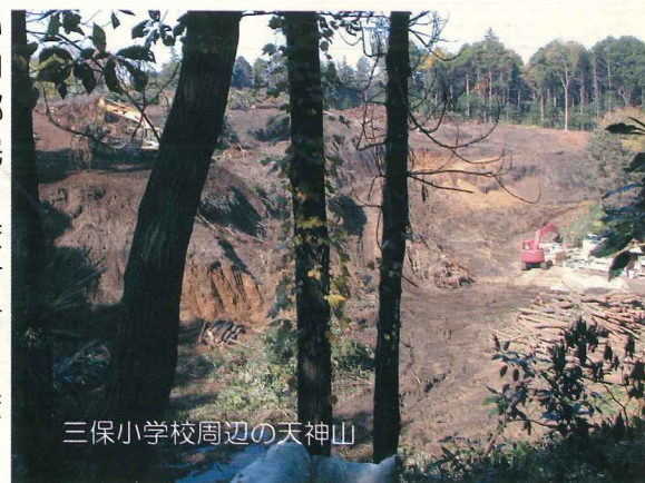
三保小学校周辺の天神山

昨年の活動を振り返って 河川改修工事が完了し、梅田川は整備から管理が大きな課題となる河川となり、平成15年4月、神奈川県から権限移譲を受け、市長管理の河川になりました。