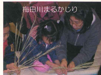
梅田川まるかじり