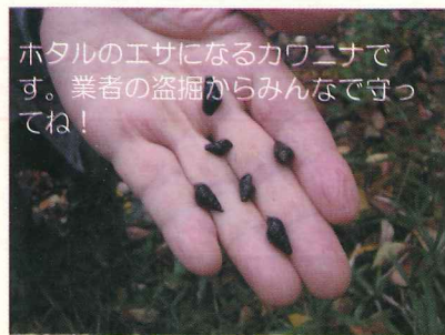
ホタルのエサになるカウエナです。業者の盗掘からみんなで守ってね!

この新聞は、財団法人 河川環境管理 財団の助成金を受けてつくられてい ます。2004. 7作成