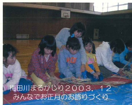
梅田川まるかじり2003.12 みんなでお正月のお飾りづくり