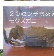
20センチもあるモクスガニ