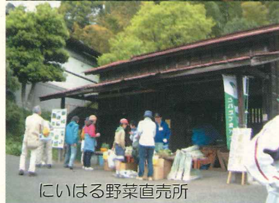
にいほる野菜直売所

編集後記 久しぶりの新聞の発行で大変お待たせしました。梅田川を取り巻く環境はここ数年大きく変わってきています。環境面では水田保全ボランティアのみなさんのおかげで今年の6月には例年になく多くのホタルが観察できました。とても感動的でした。また、市民の森愛護会のみなさんの努力によって森が明るくなり、山野草が多く見られるようになりました。しかし、盗掘も多くなりヤマユリが急に見られなくなりました。また、3年前から始まっている三保町の宅地開発で多くの森が無くなり、私が小学校の頃、通学路にしていた天神山（昔、カブトムシがいっぱいとれた雑木林）の道が無くなってしまいました。したがって梅田川流域マップも書き換えなくてはなりません。とても悲しいことです。明るいニュースとして水