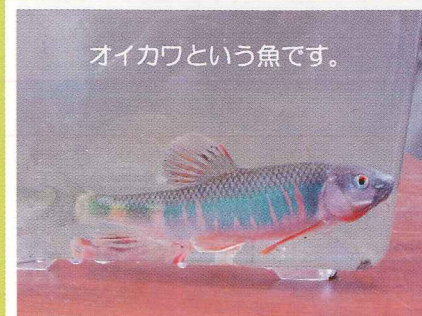
オイカワという魚です。

この新聞は、財団法人 河川環境管理財団の助成金を受けてつくられています。2001. 11作成