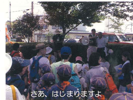
さあ、はじめますよ