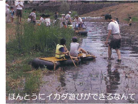
ほんとうにイカダ遊びができるなんて！

9月15日に第1回川講座が、新治小PTA主催の「新治の自然を知ろう」ウォークと合同で行われました。杉沢堰周辺の工事、梅田川遊水地の説明、新治市民の森の説明を受けながらウォークしました。