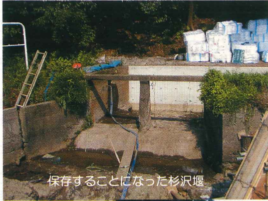
保存することになった杉沢堰

また、梅田川は河川環境に配慮した多自然型の川づくりでも、先進的な事例となっており、6月には国土交通省が視察に来ました。 緑土木事務所 山岸二興