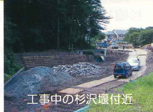
工事中の杉沢堰付近