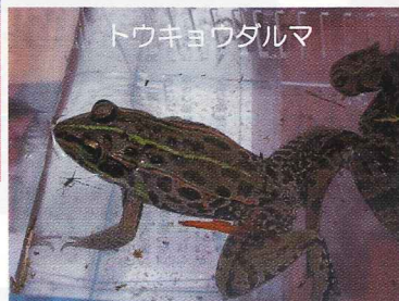
トウキョウダルマ