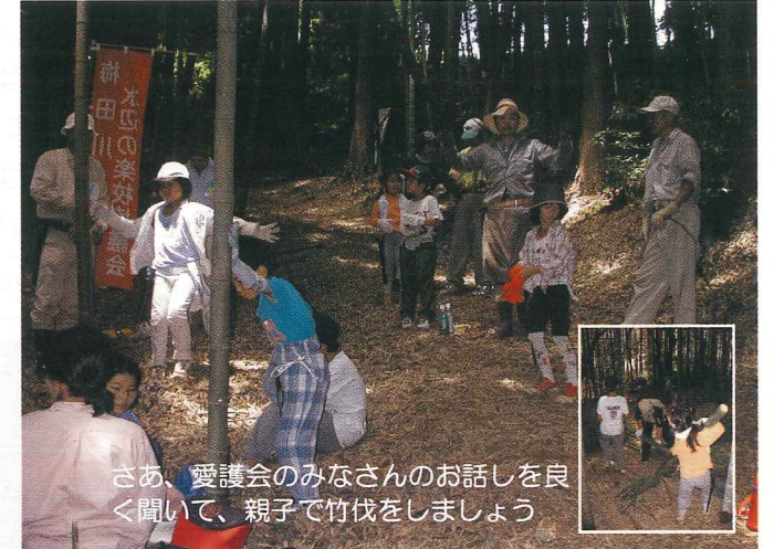
さあ、愛護会のみなさんのお話しを良く聞いて、親子で竹伐をしましょう