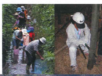
念珠坂公園から見た梅田川近辺