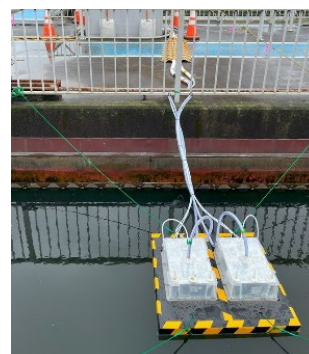
図-2 フロート式捕集器

最初沈殿池及び反応タンクのN 2 Oガスは、それぞれ脱臭ダクトから採取した。流量については、ダクト内の風速を測定し、ダクト面積を乗じることによって算出した。最終沈殿池については図-2のようにフロート式のガス捕集器を用いてガスを採取した。設置場所はN 2 Oガスの発生量が多いと思われる最終沈殿池の流入側(反応タンク側)とした。N 2 Oガスの発生量については測定したN 2 Oガス濃度にフロートの容積と最終沈殿池の水面積とフロートの捕集面積との倍率を乗じて算出した。