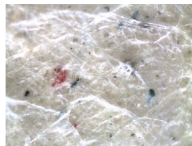
図-2 フィルター上のMP