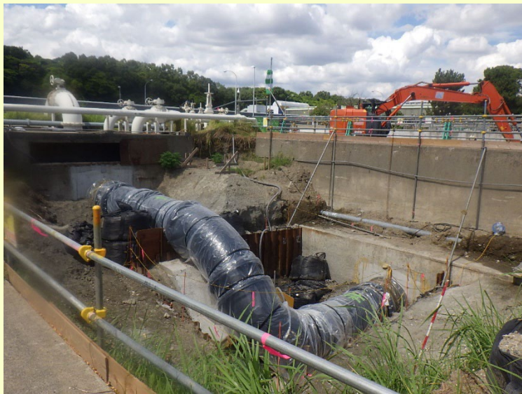
ダグタイル 鋳鉄管Φ1650布設工