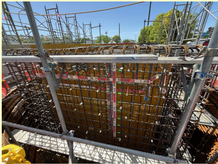
特殊人孔2 鉄筋組み立て