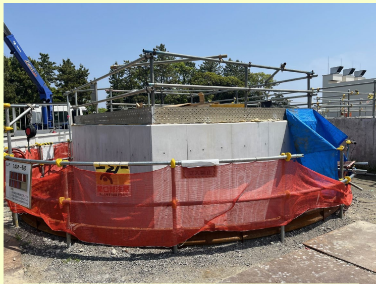
特殊人孔2 外観確認