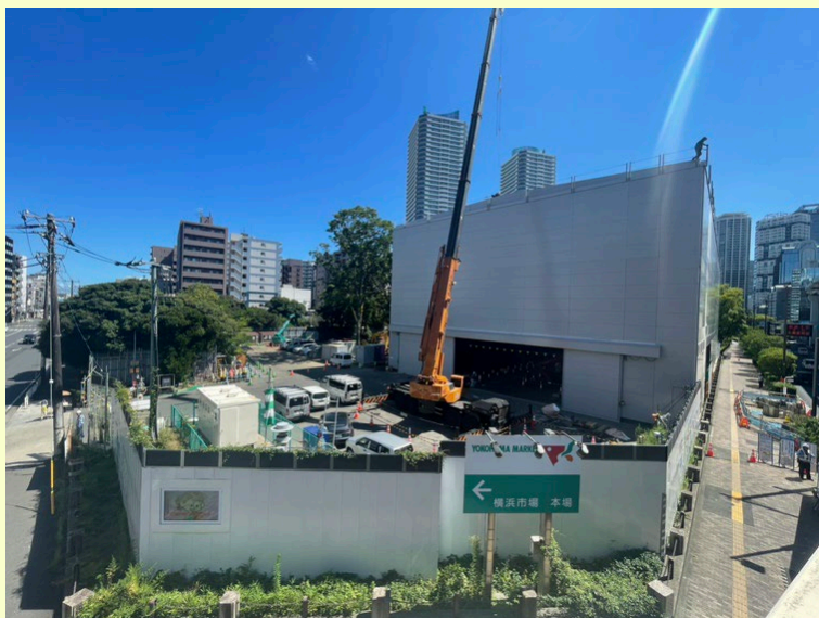
防音ハウス築造中