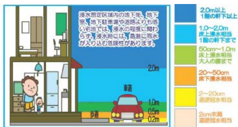
従来の内水ハザードマップ凡例

また、浸水深の凡例を変更し、想定される浸水深が1mを超える箇所の色表示を赤系に変更しています。