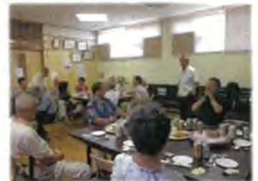
情報交換・懇親会