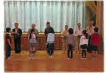
地域の代表に贈呈