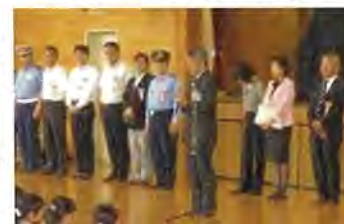
下村区長のご挨拶