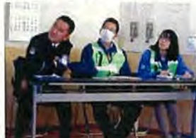
高木課長と区役所のメンバー