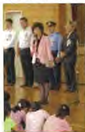
桃井西小校長(左)・副島東小校長(右)のお話