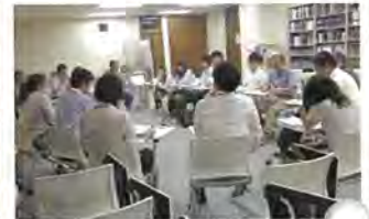
第1回(左)、第2回(右) 会合の様子