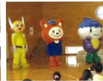
特別ゲストのお三方?