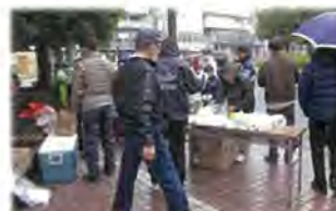
緑園都市西口本部

年末恒例の緑園一斉清掃(緑園連合自治会・RCA 共催)が12月13日(日)8時より開催されました。各自治会や各学校、サークル、団体の参加協力のもと、公園や駅周辺、四季の道などの清掃が行われ、街がきれいになりました。朝は小雨の降るあいにくの天候でしたが、本部では暖かい缶コーヒーが振る舞われました。