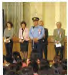
加瀬部署長の講話