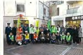
みんなで記念撮影です