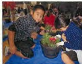
児童による植え付け