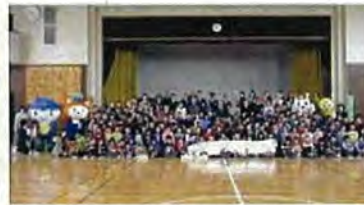
全員集合写真撮影