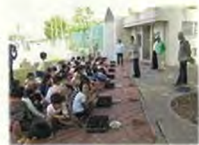
植え替えの様子(東小)