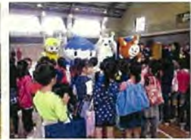
マスコットたちとの交流