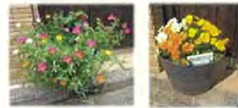
春季の花(左)と秋季の花(右)