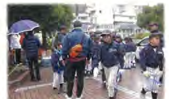
ラービーの子ども達