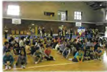
説明に聞き入る児童ら