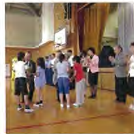
地域代表に花の贈呈