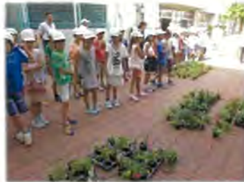
これから袋詰めです