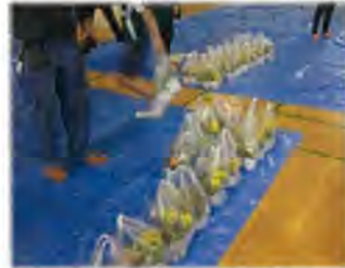
花に手紙を添えて