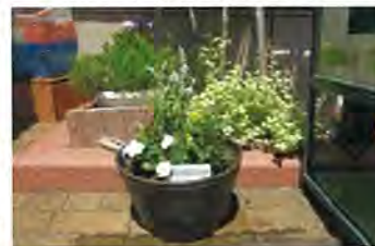
お店に置かれた鉢植え