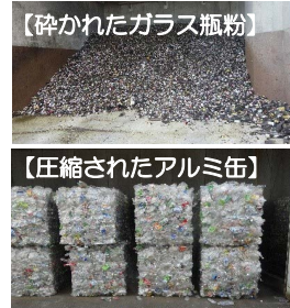
【砕かれたガラス瓶粉】