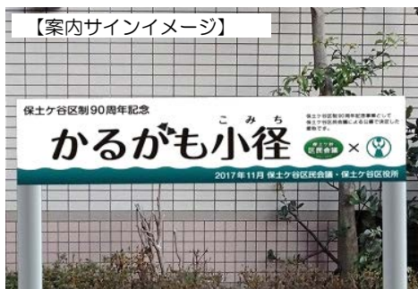
【案内サインイメージ】

保土ヶ谷区制 90 周年記念事業として取り組んだ「相鉄星川駅～区役所の小道に愛称を！」は、おかげさまで 207 点もの応募をいただき、その中から「かるがも小径」が最優秀愛称に選ばれました。