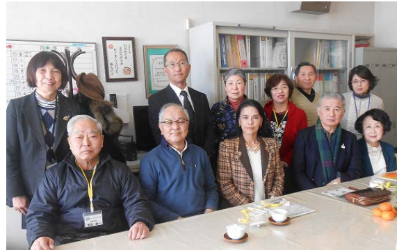
【権太坂小学校訪問 校長室にて】

第 22 期の活動テーマを「笑顔であいさつ 思いやりの心を育もう!」とし、前半の 1 年は、第 21 期からの継続活動である「保土ヶ谷区制 90 周年記念事業 相鉄星川駅～区役所の小道に愛称を!」と「あいさつ運動」に取り組みました。小道の愛称については、広報よこはまほどがや区版、タウンニュースや YCV 等での呼びかけにより、区内在住・在勤・在学の方々より 207 点もの応募をいただき、その中から区長、区連会会長及び区民会議代表による最終選考の結果「 こみち かるがも小径」と決定し、