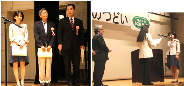
【「区民のつどい」において最優秀者 3 名の方が表彰されました】

この度、現地に「かるがも小径」の案内サインが設置される運びとなり、3 月 26 日に除幕式が行われます。並んで保土ヶ谷区制 90 周年記念モニュメントも建立されます。区民の皆さまには、お近くを通られる折、是非ご覧いただけたらと思います。