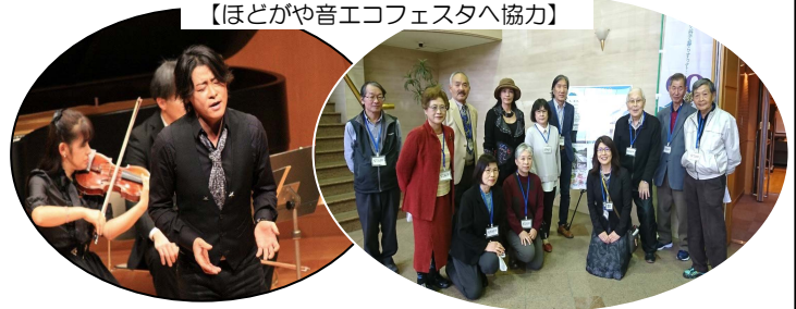
【ほどがや音エコフェスタへ協力】

後半には、「自然環境」対応としてホテル観賞会と横浜市環境科学研究所の見学会、「エコ問題」としては東京ガス根岸工場の見学会を予定して、結果に基づく啓発活動をしていきます。