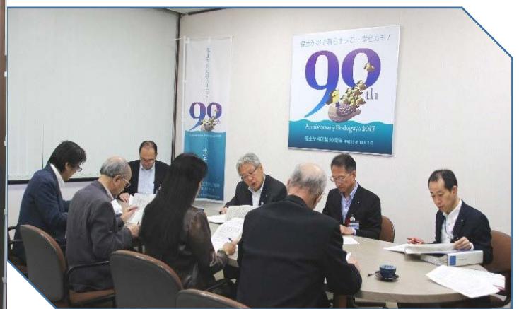
【回答書受け取り後の懇談風景】