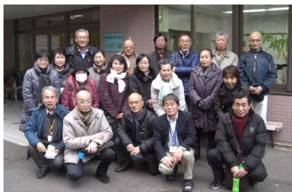
【榎太坂・光風会 (のばら園・すみれ園) 見学】

前半は高齢者福祉として「認知症支援」や「介護保険制度」について区の実情などを学んできました。平成 29 年 3 月現在、保土ヶ谷区の 65 歳以上の人口は約 5 万 3 千人、一人暮らし高齢者は約 1 万人、要介護認定者も約 1 万人です。人生 100 年時代に入って、個人にとっては介護に頼らず生き生きと暮らす工夫 (介護予防) が喫緊の課題になってきました。