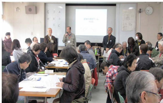
【新桜ヶ丘地区での HUG 出前講習会】