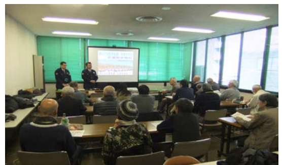
【保土ヶ谷警察署交通課の係長を講師とする勉強会】