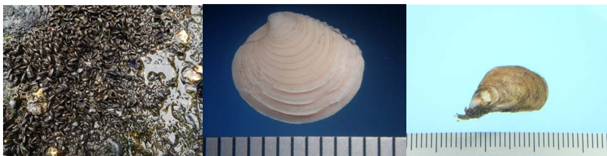
図3 調査で確認された外来種（海岸動物）の写真

表3に出現した外来種の変遷を示す。海岸動物における外来種の確認種類数は徐々に増加傾向にあることがわかる。これまでの調査でもイガイ類やフジツボ類の外来種は、1985年から記録があり、長年に渡り定着している。一方、シナハマグリやチチュウカイミドリガニの記録は散発的である。ホンビノスイガイ、イガイダマシ、カニヤドリカンザシゴカイはそれぞれ、第13報、第12報、第11報から記録がある。