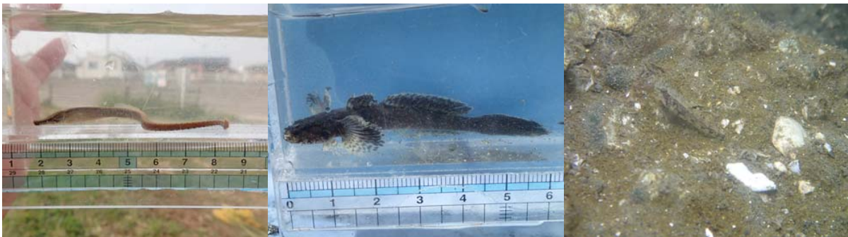
図2 調査で確認された魚類の写真

地球の海面水温は、温暖化に伴い上昇しており、魚類を含む海域生物の多様性に強く影響を与える要因となる。専門家は、近年暖水性魚類が全体的に北上傾向にあると報告している。上記した南方系魚種3種が確認された背景には海域環境の変化が起因している可能性がある。今後横浜においても南方系魚種が定着していくことが予想される。