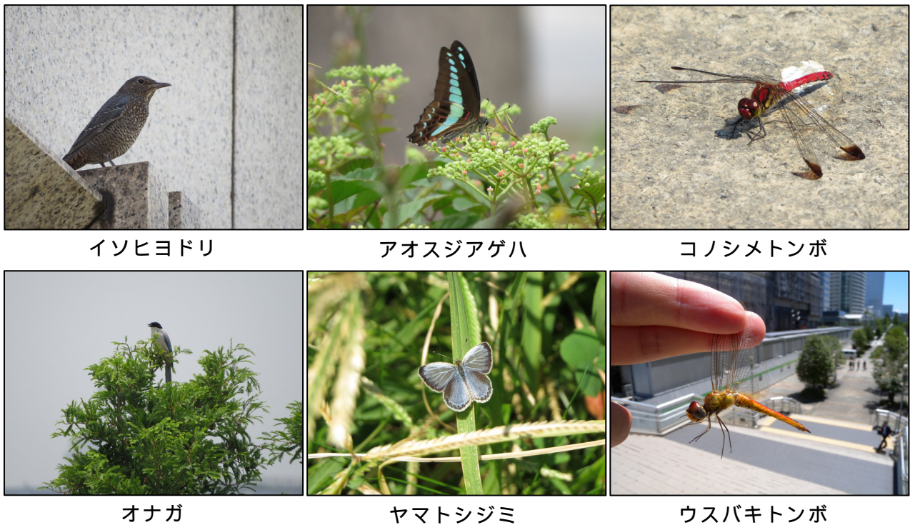
図2 公園内で確認された鳥類・昆虫（チョウ・トンボ）類

また、チョウ類は花壇や幼虫の餌となる植栽木を、トンボ類は美術の広場前の水場（図1の水景）を中心に種数、個体数が多かった。