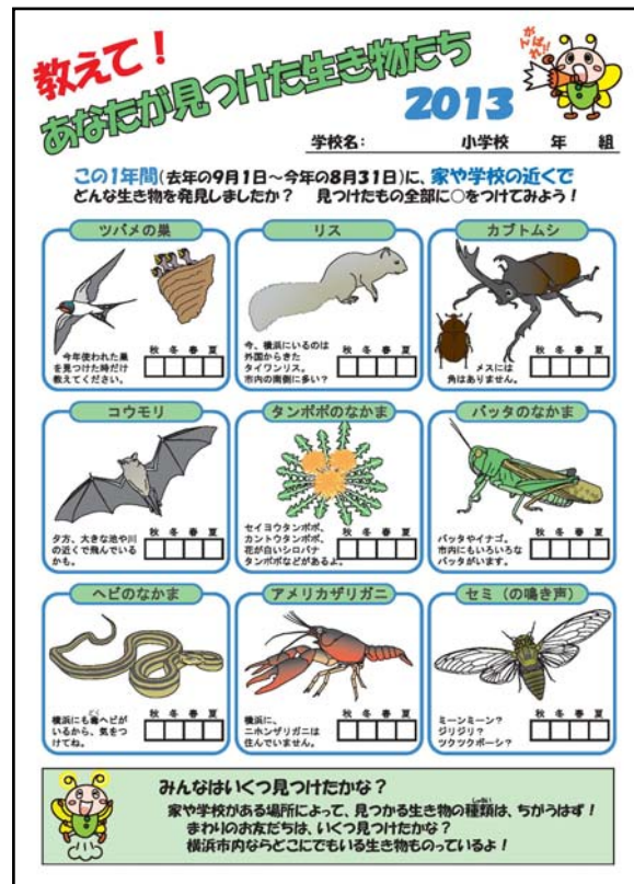
図 1 調査票（表面）

また、作図にあたっては、1 校あたりの回答数が 10 名以上の 145 校のデータを使用した。