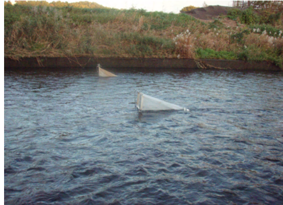
アユ流下仔魚調査設置状況(S3-4)