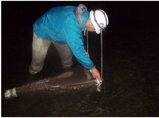
アユ流下仔魚調査設置作業(T4)