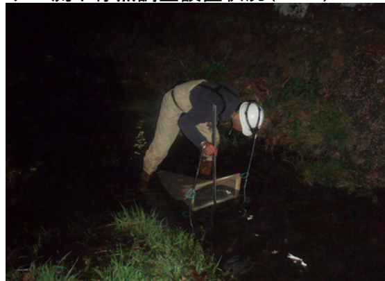
アユ流下仔魚調査水深測定(J2)