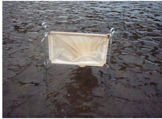
アユ流下仔魚調査設置状況(T4)