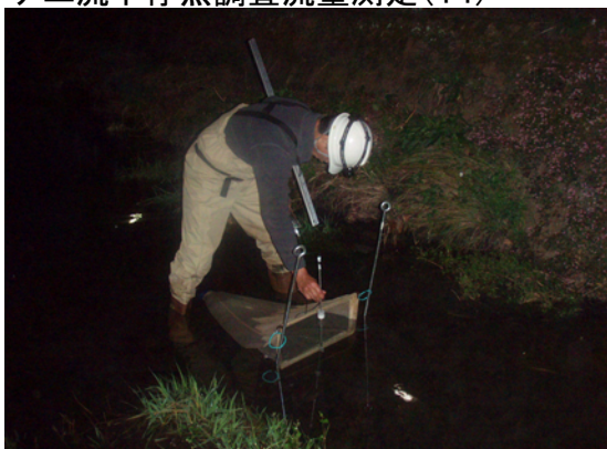
アユ流下仔魚調査流速測定(J2)