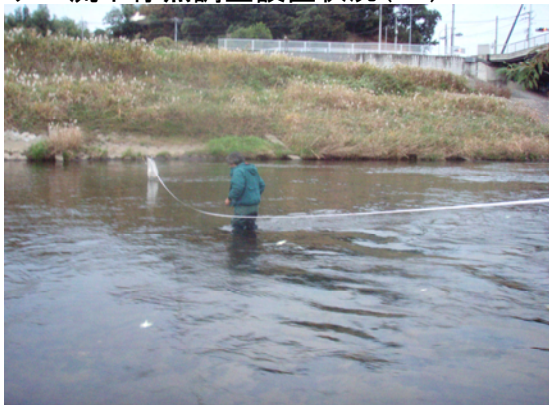
アユ流下仔魚調査流量測定(T4)