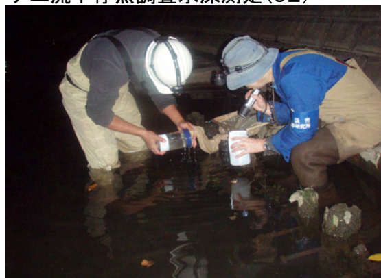
アユ流下仔魚調査回収作業(O4-2)