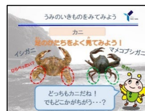
パワーポイントの例