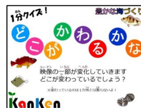
1分クイズ!どこがかわるかな