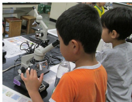
顕微鏡観察の様子