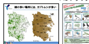
講義資料の例 調査票