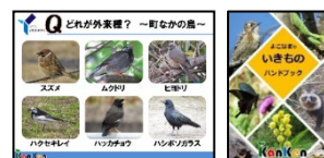
講義資料の例 よこはまのいきものハンドブック

身の回りにどんな生き物がいるのか調査し、その地域の環境やすんでいる生き物の魅力や大切さについて考えるきっかけを作ります。