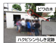
校庭での実習の様子