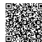
②講座登録申請フォーム

https://shinsei.city.yokohama.lg.jp/cu/141003/ea/residents/procedures/apply/56d9f431-192e-482e-871a-0b14d3323880/start