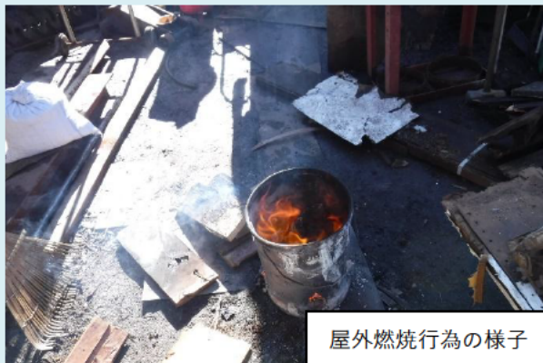
屋外燃焼行為の様子

屋外燃焼（野焼き）は原則禁止となっていますが、例外的に制限がかからない行為もあります。そのような行為であっても、市に相談が寄せられた際は、現地調査の上、焼却物を十分に乾燥させる、風向きに注意するなどについて、行為者に配慮要請を行っています。