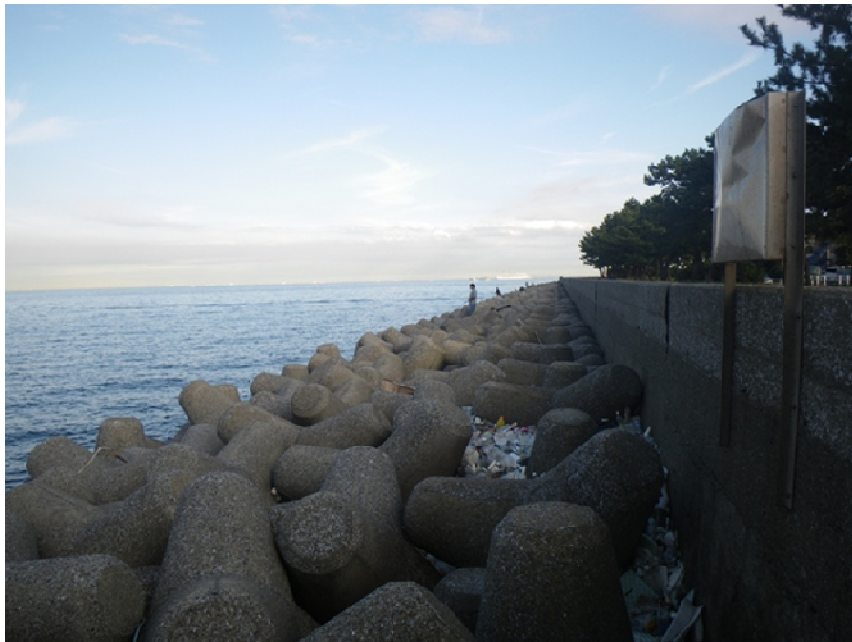
写真 計画地東側の港湾緑地付近における釣客の状況

福浦一丁目にある公園については他の保全対象と同様、計画地から直近となる公園敷地内の任意点において大気拡散計算を実施する予定ですが、港湾緑地については計画地周辺を線状に取り囲んでいることから、計画地南北方向における港湾緑地周辺の最大着地濃度を算出し、予測を実施する予定としております。