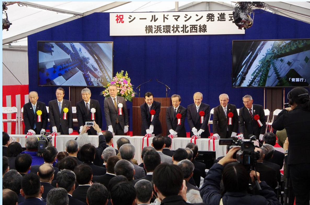
～シールドマシン発進ボタンを押す列席者～

平成29年3月27日（月）、緑区北八朔町の北八朔発進立坑ヤード内において、シールドマシン発進式が開催され、シールドマシンによる掘削が始まりました！