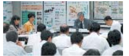
第7回有識者委員会

「概略計画の検討状況」で提供する情報は、たたき台に対する市民のご意見をふまえて、行政が現段階で考える内容を示すものであることから、ご意見をいただく前に内容をみなさまにご理解いただくため、行政が内容を説明する必要があることから、オープンハウス等従来のPI手法に加え、周辺自治会・町内会との会合等を活用して積極的に市民等のみなさまに伝えていくべき。「概略計画の検討状況」を提示した後も必要に応じて追加情報を提示することを明確にすべき。