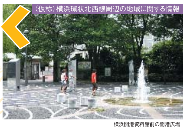
(仮称)横浜環状北西線周辺の地域に関する情報

今年、開国150周年。開港の舞台となったヨコハマには、建物そのものが重要文化財の神奈川県立歴史博物館や旧英国総領事館の横浜開港資料館など、近代洋風建築の傑作が点在し、建物ウォッチングを楽しみながら、横浜のハイカラな文化や歴史にふれることができます。また、先土器時代から現代までの横浜の歴史、宇宙・科学をテーマにした博物館や科学館もあります。知的好奇心をくすぐるスポットへ出かけ、ふるさと横浜を身近に感じてみませんか。 (各データの図は交通です。各スポットへアクセスしやすい交通を表していますので、お出かけの参考に。なお、資料整理などで休館になることもあります)