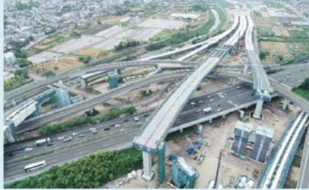
①横浜青葉IC・JCT付近の架設状況