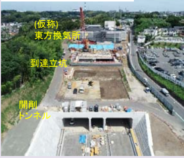
⑧全景（港北側から青葉方面）