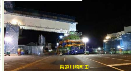
⑩県道川崎町田上部工架設（H30.1.13・1.20 通行止め）