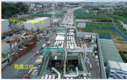
④全景（プラントヤード・発進立坑）