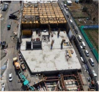
⑤(仮称)北八朔換気所