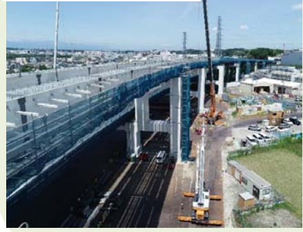
⑪鋼製橋脚及び上部工架設の状況