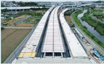
②上部工の架設状況