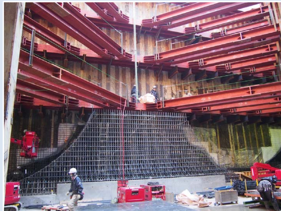
③ 発進立坑側壁の鉄筋組立状況 (H28.1撮影)