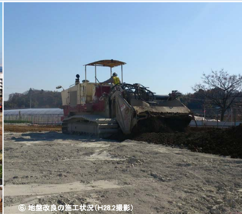
⑥ 地盤改良の施工状況 (H28.2撮影)