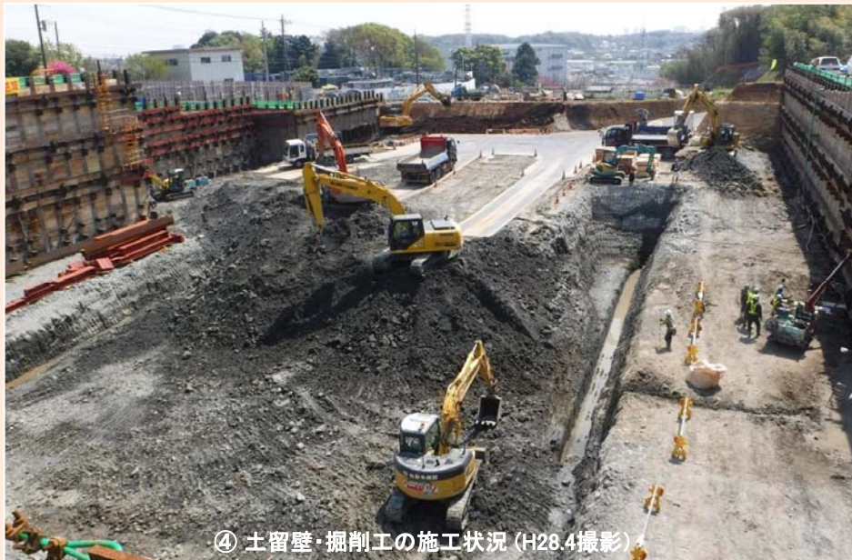
④ 土留壁・掘削工の施工状況 (H28.4撮影)