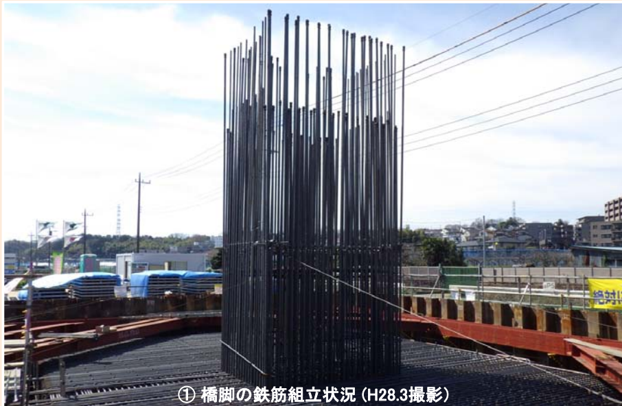
① 橋脚の鉄筋組立状況 (H28.3撮影)