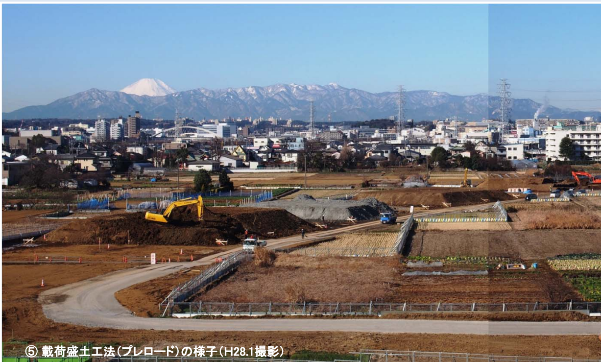
⑤ 載荷盛土工法(プレロード)の様子 (H28.1撮影)