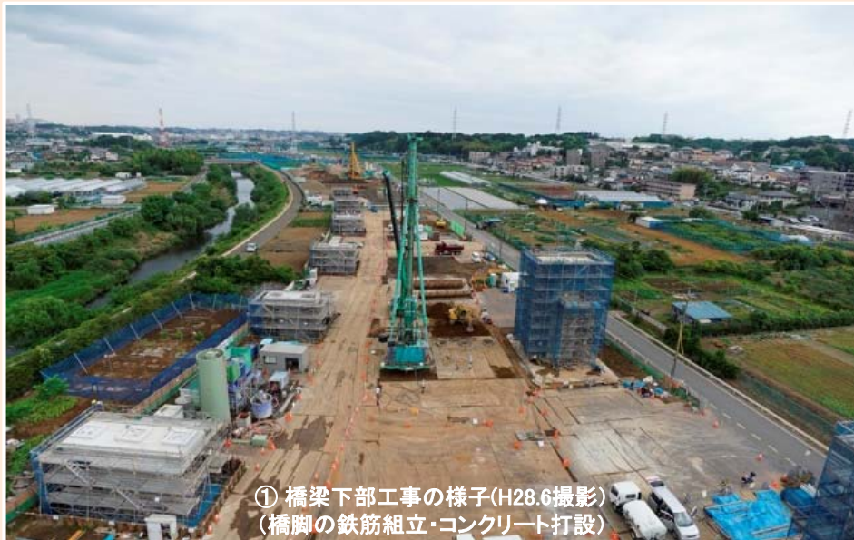
① 橋梁下部工事の様子(H28.6撮影) (橋脚の鉄筋組立・コンクリート打設)