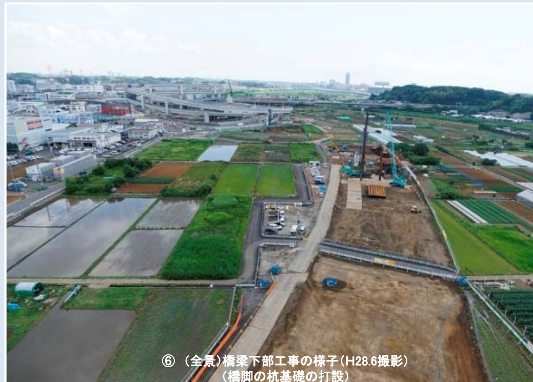
⑥ (全景)橋梁下部工事の様子(H28.6撮影) (橋脚の杭基礎の打設)