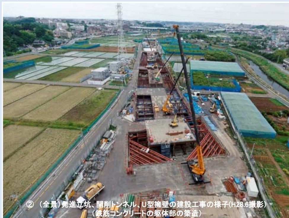
② (全景) 発進立坑、開削トンネル、U型擁壁の建設工事の様子(H28.6撮影) (鉄筋コンクリートの躯体部の築造)