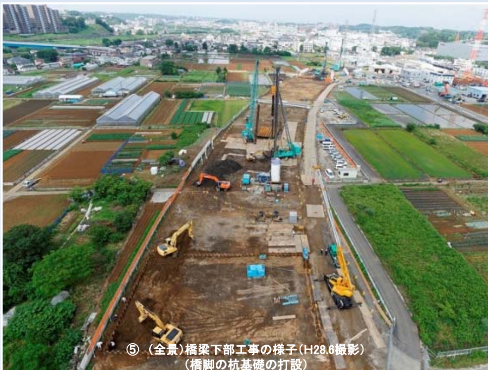
⑤ (全景)橋梁下部工事の様子(H28.6撮影) (橋脚の杭基礎の打設)