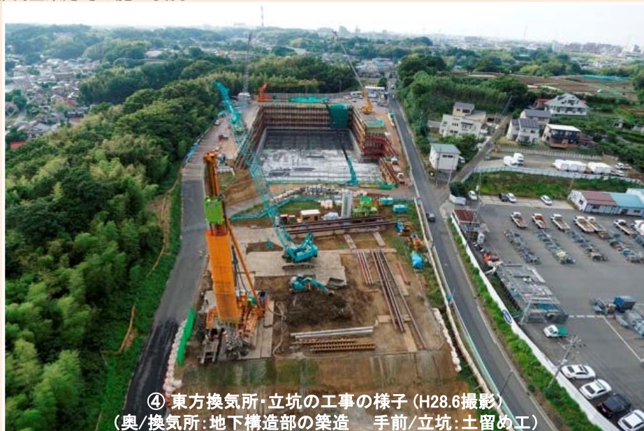
④ 東方換気所・立坑の工事の様子 (H28.6撮影) (奥/換気所:地下構造部の築造 手前/立坑:土留め工)