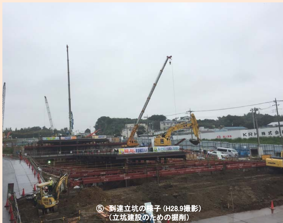
⑤ 到達立坑の様子 (H28.9撮影) (立坑建設のための掘削)