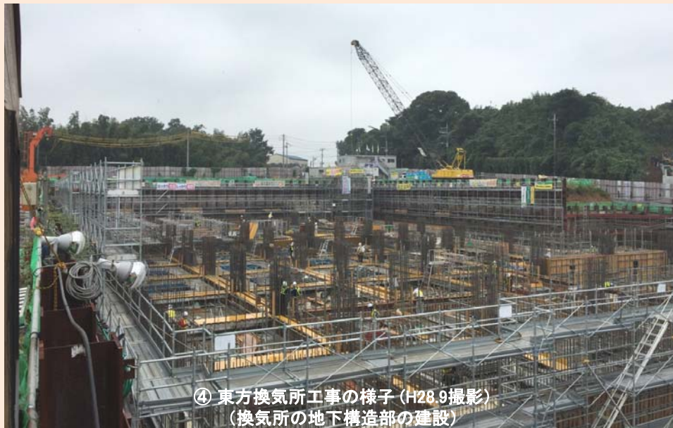
④ 東方換気所工事の様子 (H28.9撮影) (換気所の地下構造部の建設)