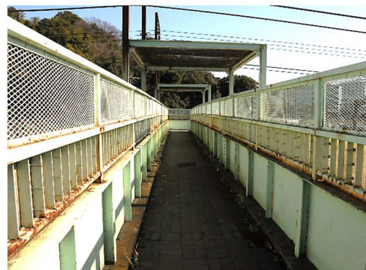
工事前（市内補修事例より）