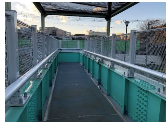
工事後（市内補修事例より）