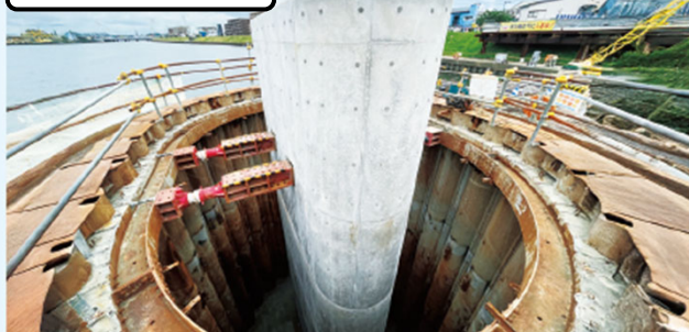
橋脚の完成 令和6年6月（2024年6月）