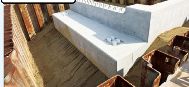
橋台の完成 令和5年6月（2023年6月）