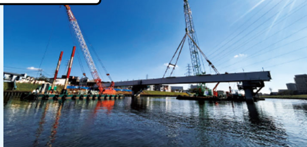
水上での架設状況 令和6年11月（2024年11月）