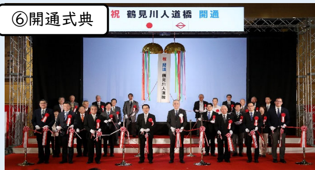
開通式典（矢向中学校） 令和7年3月27日（2025年3月27日）