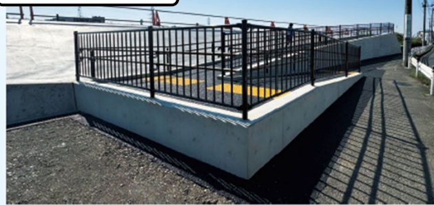
矢向方のスロープ完成 令和7年3月（2025年3月）