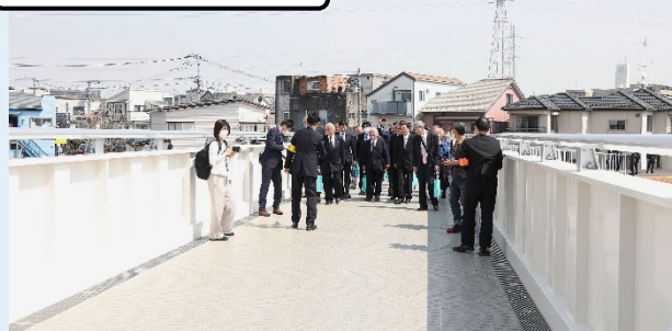
渡り初め 令和7年3月27日（2025年3月27日）

整備経過の様子は、横浜市のホームページにて動画でも紹介しています。ぜひご覧ください。