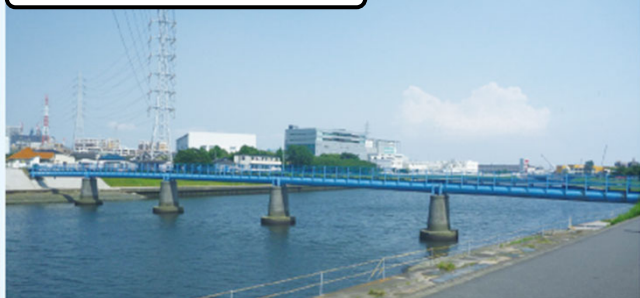
水管橋の状況 平成26年（2014年）