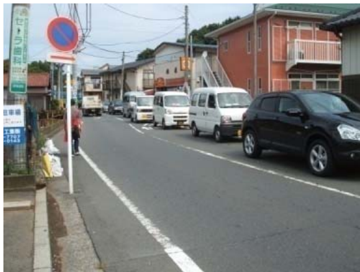
宮内新横浜線と交差する新羽287号線 (新吉田南交差点東側)