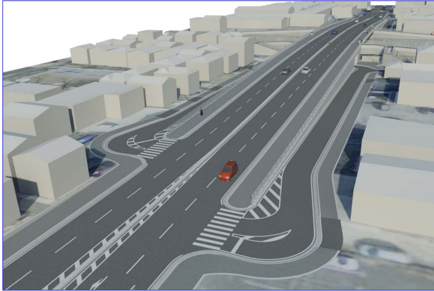
早瀬川に架かる橋梁部を南から臨んだイメージ