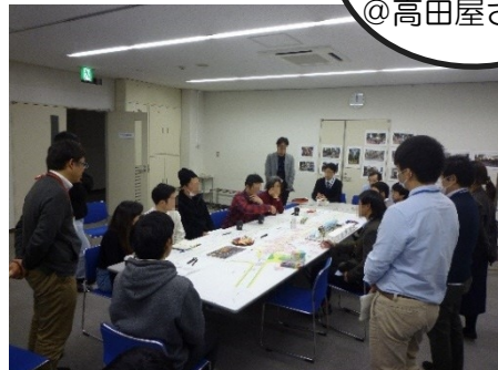
写真 意見交換会の様子

当日は、道路再整備事業の概要、周辺の開発状況、他都市などの道路整備、道路活用の先進事例をご紹介した後、現在の道路の使い方・課題や、将来、歩道が拡幅された場合の利活用について、幅広く意見交換を行いました。