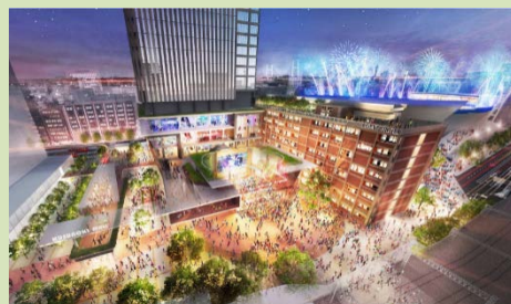
大規模なまちづくりプロジェクトの例

そのために、道路に対する沿道の皆さまのニーズの把握や、合意形成、ご協力が必要であると考えております。