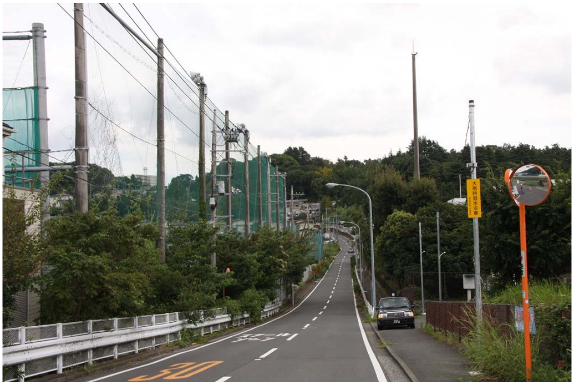
藤沢市方面側から