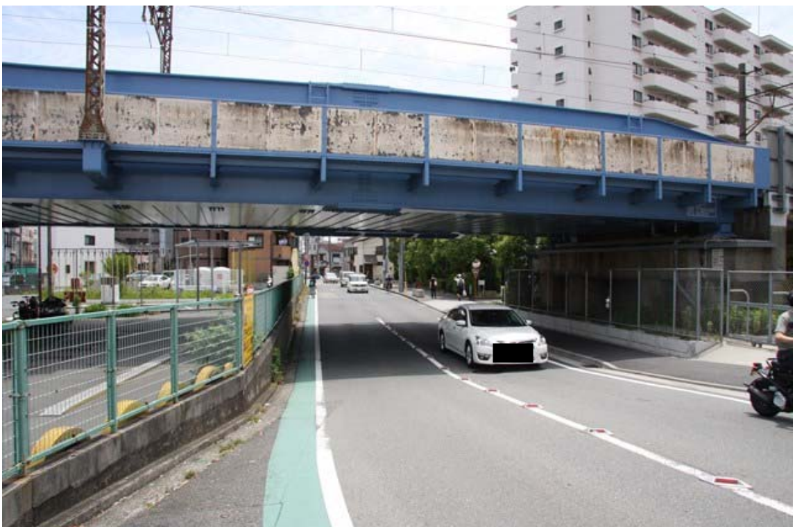
国道 1 号線側から