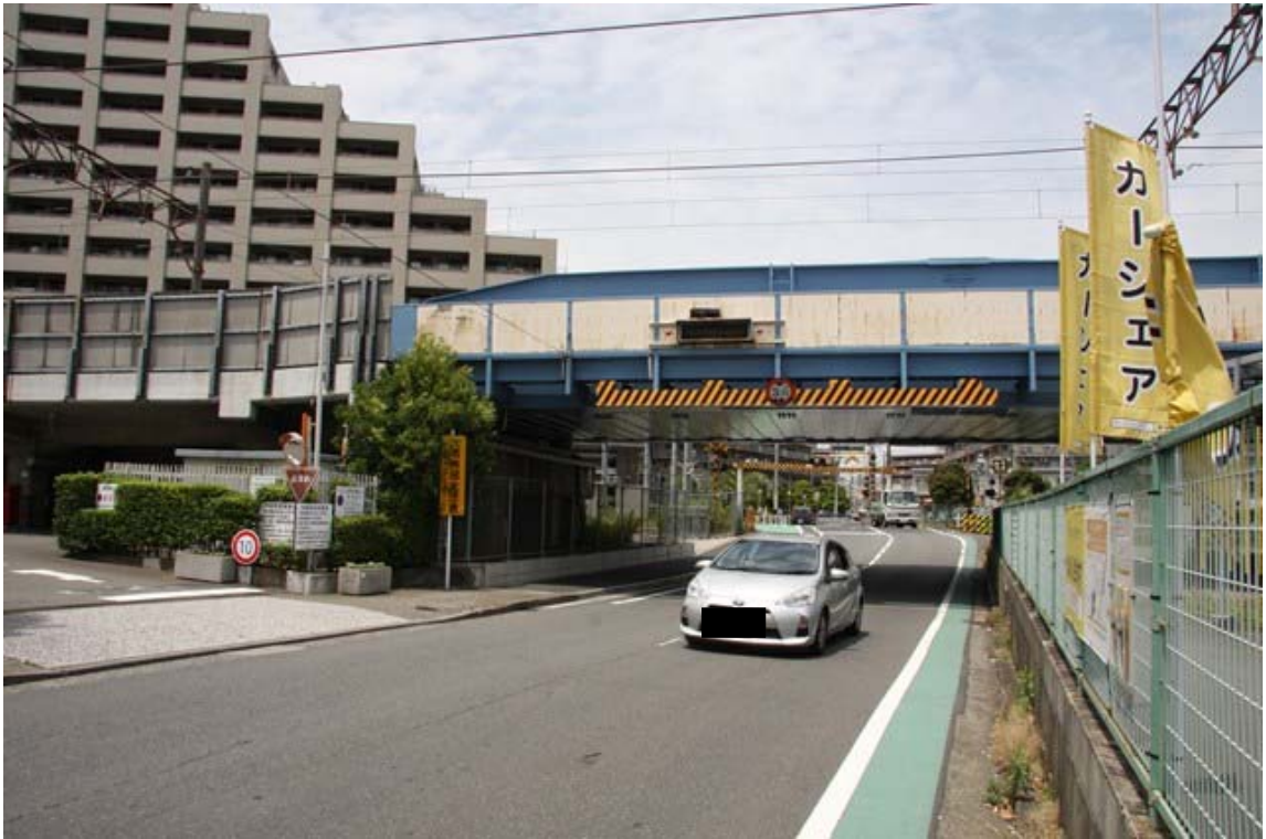
国道 15 号線側から