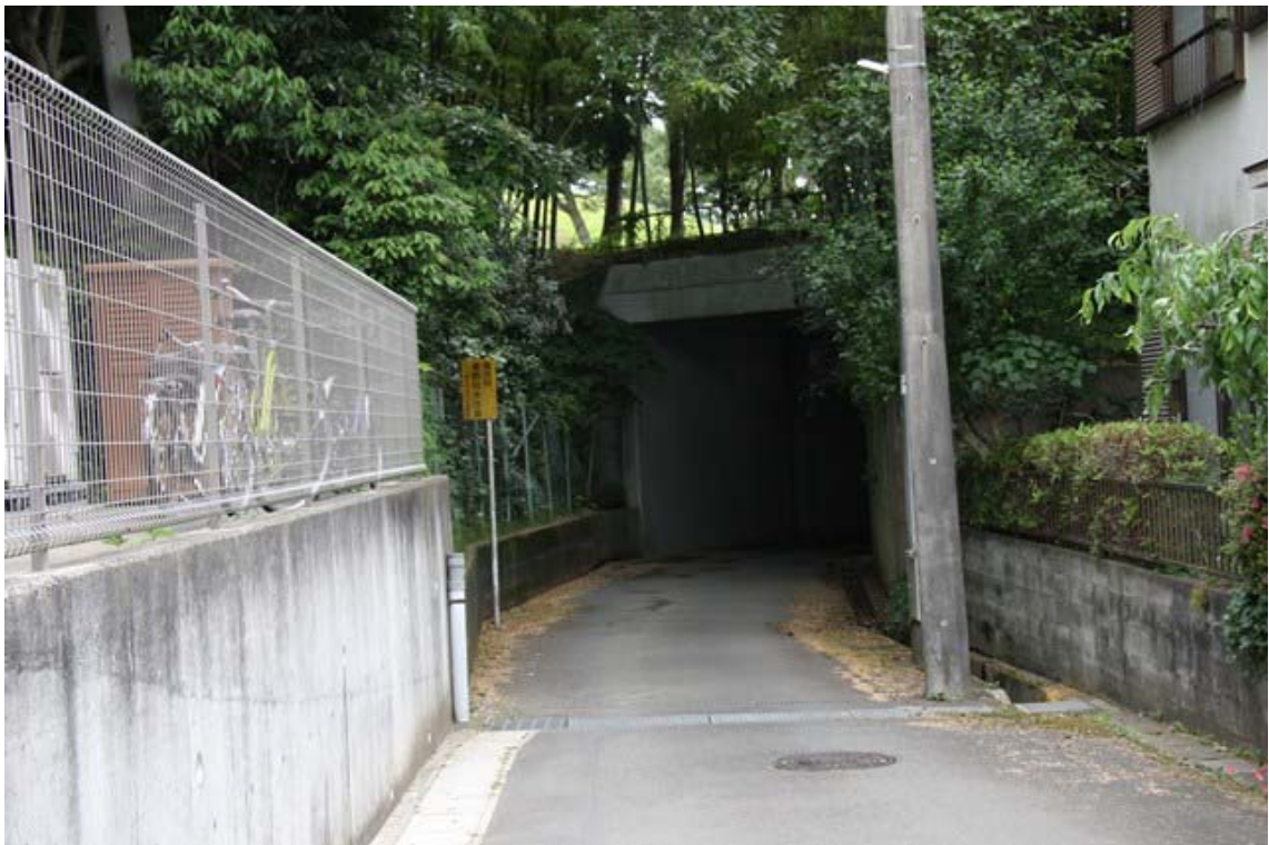
横浜カントリークラブ側から