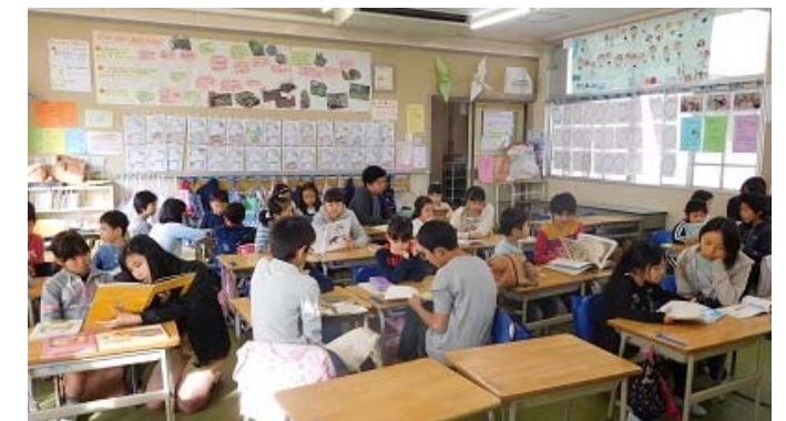
「学校司書と教諭が連携し、全校で行ったペア読書の様子」 榎が丘小学校（青葉区）

平成25年度から小中学校への学校司書の配置が開始され、平成28年度には全校配置を達成しました。学校司書の配置により、学校図書館の来館者数や貸出冊数が大幅に増加するなど、配置の効果が現れています。こうした中、平成29年度以降毎年、横浜市の小中学校が「子供の読書活動優秀実践校」として文部科学大臣よりコンスタントに表彰されています。