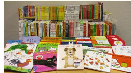
サポーターズ寄附金により購入した絵本