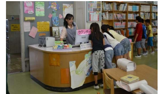
「学校司書の学校図書館での活動の様子」 峯小学校（保土ケ谷区）

本計画は、平成26年3月策定の「横浜市民読書活動推進計画（H26～H30）」の取組の成果と課題や、学校図書館法の改正、情報通信技術（ICT）の普及・多様化など読書環境を取り巻く諸情勢の変化、また、令和元年6月28日に公布、施行された読書バリアフリー法の趣旨を踏まえ、今後の施策の方向性と取組を示すものとして策定します。