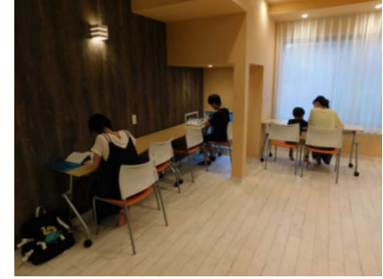
“こんなところに自習室が！”