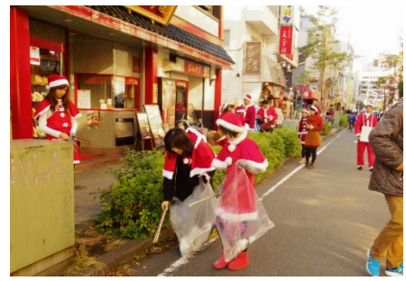
“サンタと一緒に街をキレイにしてきた”