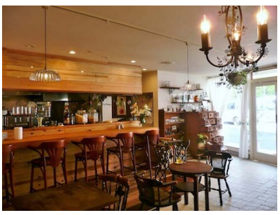
“今日は中山のカフェで打合せ”