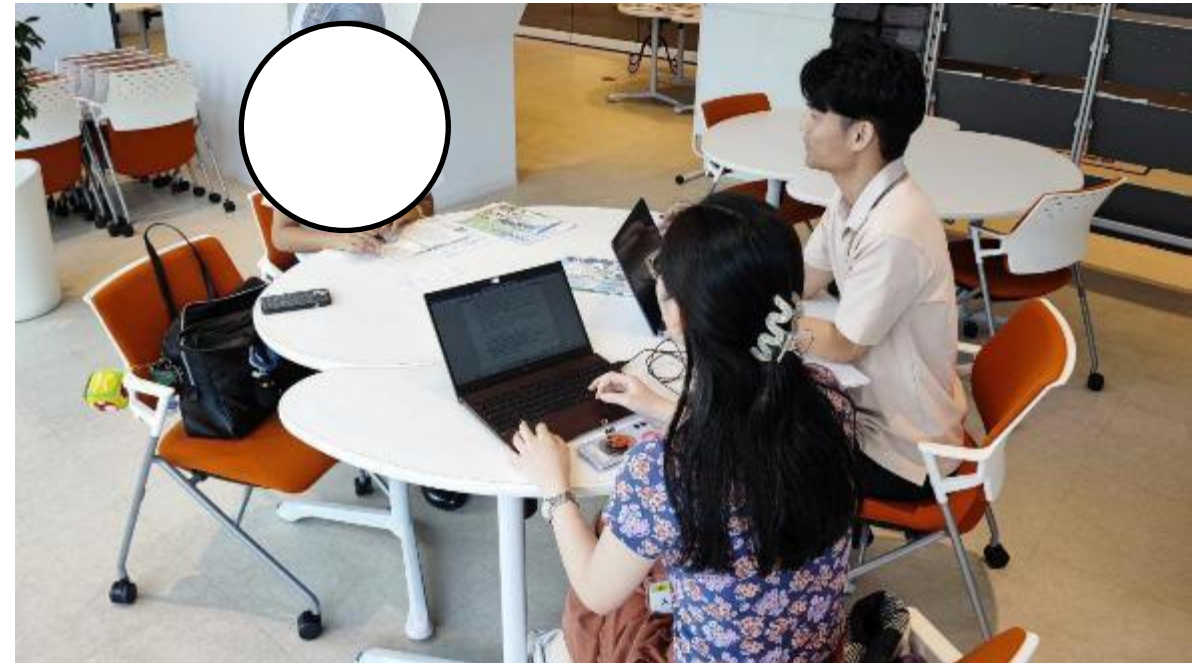
相談の様子：高校生の居場所づくりに関する相談対応