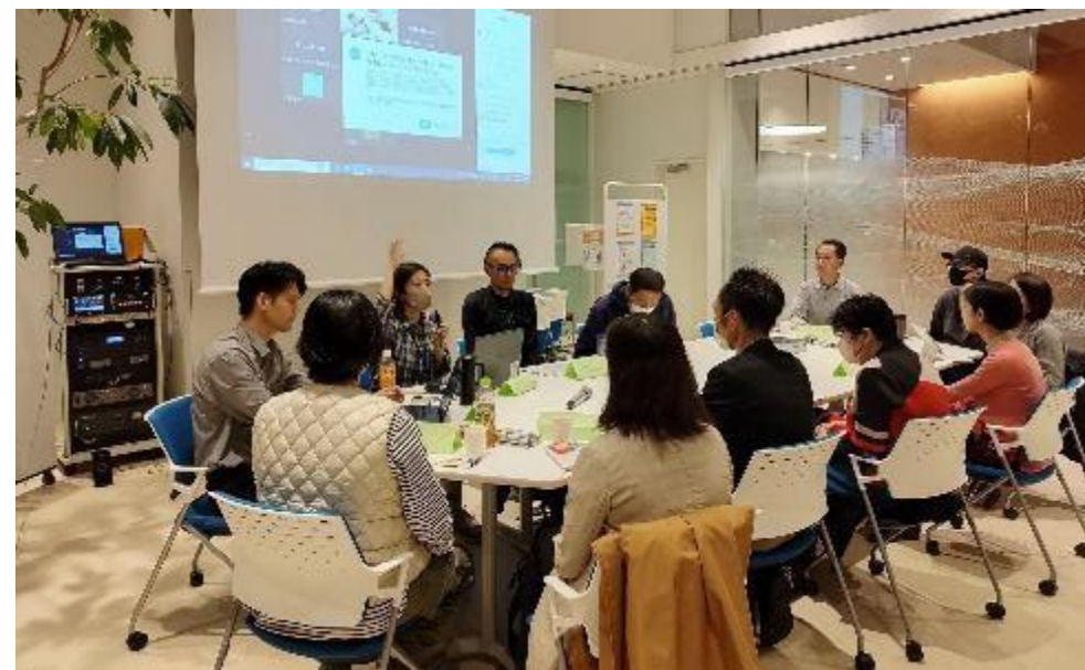
開催当日の様子：2023年度ミズベサロン 我々が考える「生き方、働き方」とは