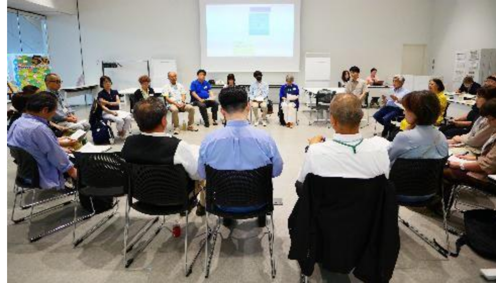
開催当日の様子：2026年度協働HUB ローカルコーディネーター交流会