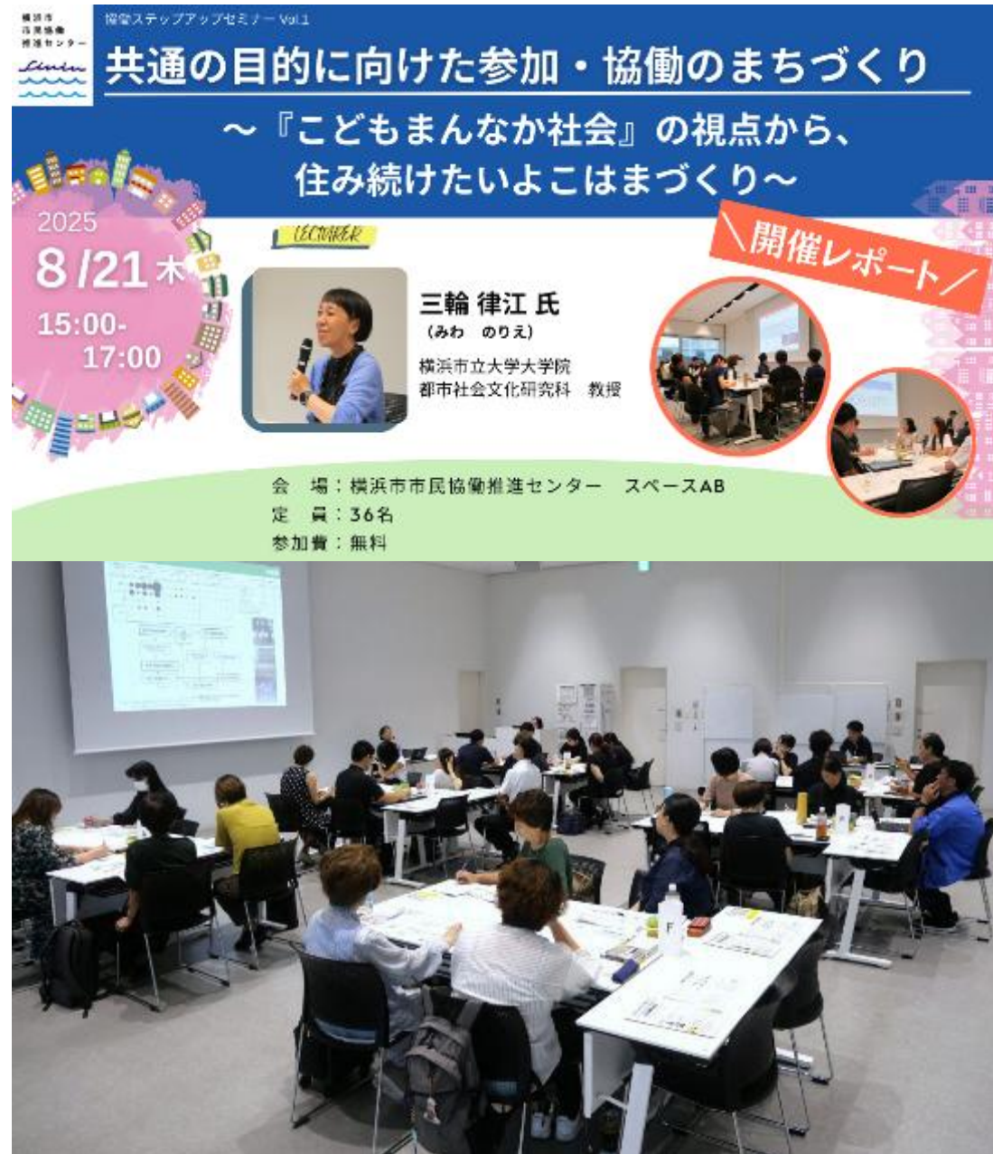
開催当日の様子：2025年度協働ステップアップセミナー