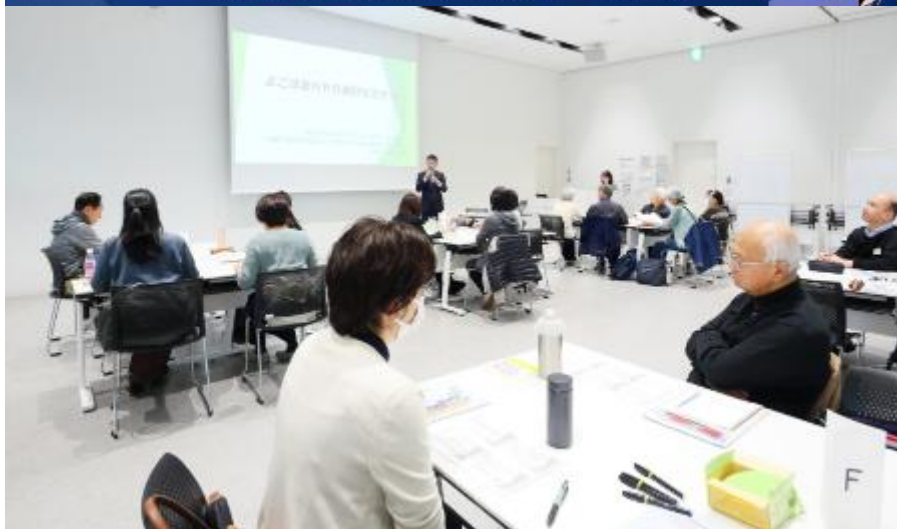
開催当日の様子：2025年度よこはNPO会計セミナー