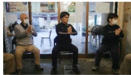
竹山団地における大学生による介護予防教室