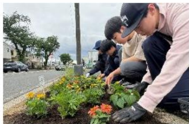
廃棄予定の花苗を地域に植栽する フラワーアッププロジェクト

※資源・製品のリサイクルを中心に展開する一般的な循環型経済に加えて、そこに関わる「ひと」にも着目した共生社会の実現を目指した取組。生活上の困難を抱える方であっても安心して働き、暮らせる、「誰一人として取り残されない持続可能な社会」を目指す経済活動を示す考え方