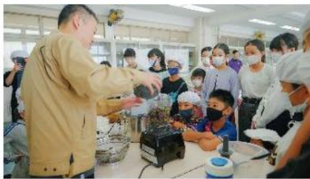
横浜オリブプロジェクトにおける 小学生へのキャリア教育