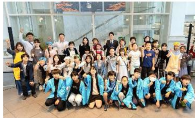
ネイチャーキッズフェスタ（令和7年10月）

こども・若者を中心とする公民連携の取組 を広く発信するために、「よこはま未来の 実践会議」等を実施します。