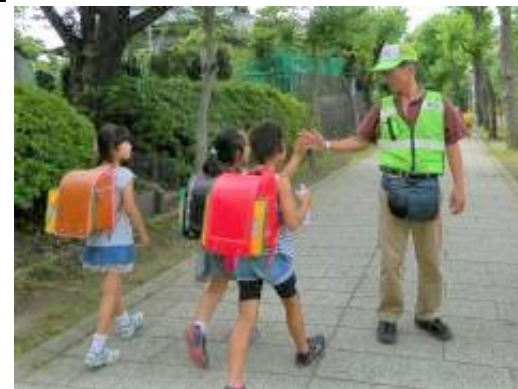
地域の見守り活動の様子

また、自治会町内会加入・活性化促進事業として、市町内会連合会とともに自治会町内会活動のPRや地域活動の事例紹介等に取り組み、自治会町内会への加入を促進します。