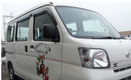
上：図書取次サービス車です。 扉のマスコットキャラクターは やまちゃん です。