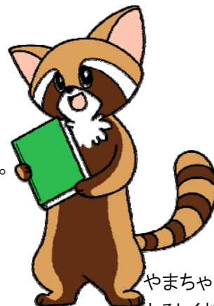
やまちゃん です。 よろしくお願いいたします。

指定管理者制度は多様化する市民ニーズに、より効果的・効率的に対応するため、 公の施設の管理に民間のノウハウを活用しながら、市民サービスの向上と経費の節減 を図ることを目的に、平成15年6月の地方自治法改正により創設されたものです。