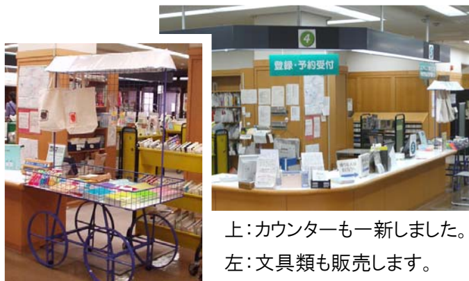
上：カウンターも一新しました。 左：文具類も販売します。