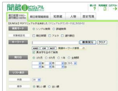
検索画面イメージ