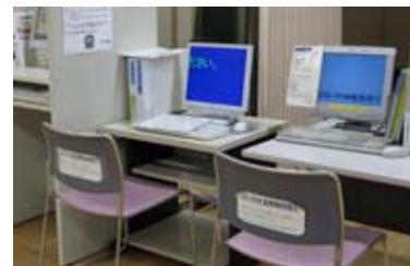
インターネットコーナー（戸塚図書館）

また、市立図書館のインターネット閲覧サービスでは、商用データベース『聞蔵Ⅱビジュアル for Libraries』で朝日新聞等の記事検索が利用できます。古い新聞記事を探している方から、最新の記事を探している方まで、幅広いニーズにお応えします！