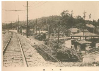
昭和初頭の菊名駅周辺