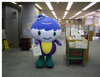
〔昨年度の様子です〕

ミニ講座や工作会、紙芝居など、子どもから大人まで楽しめるイベントがいっぱい。泉区の「いっずん」も登場するよ！ 〔日時〕11/15(日)10:00～16:00 〔会場〕泉図書館