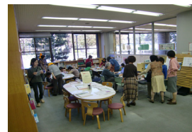
〔昨年度の様子です〕

〔内容〕緑図書館で本を修理して下さるボランティアを募集します。募集にともない、修理技術の基礎を学んでいただくための、連続講座(全2回)を開催。本の構造に関する知識、簡単な修理の技術について、実習もおこないます。 〔日時〕11/20(金)、11/27(金) 各日 10:00～12:30 〔対象〕緑図書館で本の修理ボランティアをして下さる方 〔会場〕ほのぼの荘会議室(緑図書館2階) 〔申込〕11/11(水)9:30～緑図書館カウンターまたは電話で。 〔定員〕先着 15人