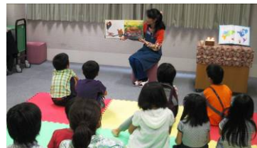
夏休みのおはなし会の様子