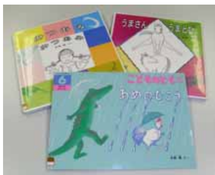
左奥 『みつあみみつあみ』 小峰書店 右奥 『うまさんうまとび』 小峰書店 手前 『あめのむこう』 福音館書店

A. これからも自分が楽しい、おもしろい、遊び心ある絵本を作っていきたい。子どもたちには、それを見て視覚で遊び、読んで言葉で遊んで、自分でもお話を作りながら、楽しい時間を過ごしてもらえればいいなと思います。