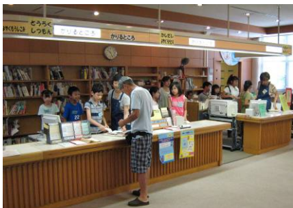
夏休みの一日図書館員の様子