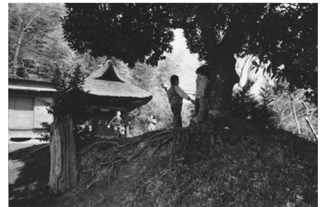
「神社で遊ぶ子どもたち」

〔内容〕「世界エイズデー」(12/1)に合わせ、エイズ予防・啓発のためのパネル、リーフレットなどの展示を実施します。 〔期間〕12/8(火)～12/14(月) 〔会場〕山内図書館エントランス