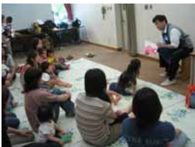
親子で楽しむおはなし会(鶴見図書館)

〔日時〕1/23(水) 10:30～11:00 〔対象〕3歳以下の乳幼児と保護者 先着12組 〔申込〕当日直接会場へ 〔会場〕旭図書館1階会議室