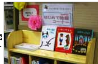
〔緑図書館〕はじめて物語コーナー

緑図書館 「読んでみよう こんな本」 〔日時〕4/30(水)10:00～12:00 〔対象〕一般市民 25人 〔会場〕緑図書館会議室 〔内容〕2～3年以内に出版された児童書の中からおすすめの本を紹介し、また、家庭内の読書や地域でのおはなし会、ブックトークなどボランティア活動の中で読書を推進するために役立つ児童書の情報を司書がブックトーク形式で紹介し、 〔申込〕4/16(水)9:30～ 緑図書館カウンター又は電話で