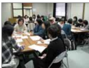
〔港南図書館〕おはなしボランティア交流会(平成18年度)

磯子図書館 「読み聞かせボランティア交流会」 〔日時〕4/25(金)13:30～15:00 〔対象〕主に磯子区内で読み聞かせ等のボランティア活動をしている方。抽選25人(1グループからは2人まで) 〔会場〕磯子図書館会議室 〔内容〕日ごろ感じている疑問や悩み、新たなアイデアなどを持ち寄って、話し合ってみませんか？図書館からは、最近出版されたおすすめの本や読み聞かせのポイントについてお話しします。 〔申込〕往復はがき 4/15(火)必着 記入事項 氏名・電話番号・活動年(月)数・所属団体名・活動場所・質問や話し合いたいこと。