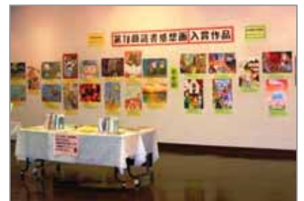
「読書感想画展」(平成18年度)より (第18回読書感想画コンクール 入賞作品を展示しました。)