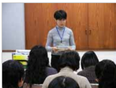
平成19年度 おはなしボランティア 講座風景

http://www.city.yokohama.jp/me/kyoiku/library/