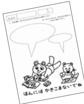
マナー向上「ぬりえ」 (港北図書館 平成19年度)