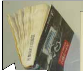
水に濡れ、よれてしまった文庫本。

書込みがされたり、線を引かれたり、一部を切り取られたりしたために、毎年多くの本が利用できなくなっています。 図書館の本は、市民の財産です。 大切にしましょう。