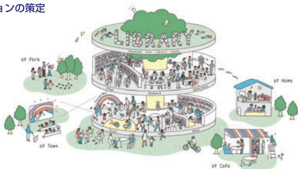
横浜市図書館ビジョンで示される新たな図書館像のイメージ

策定に向けて、6月から7月には全4回の市民ワークショップを開催し、横浜市の図書館の未来について語り合いました。また、5月と12月に様々な分野の有識者のご意見をお聞きし、検討を進めました。