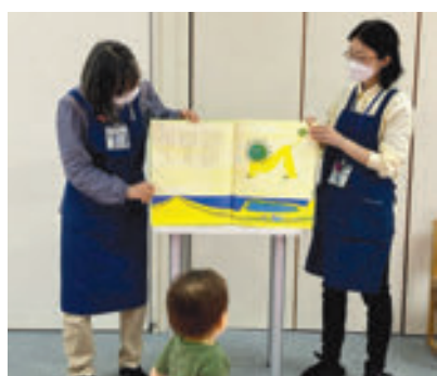
磯子図書館 おいしいおはなし会