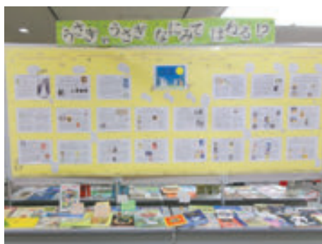
磯子図書館 市民協働展示「うさぎ、うさぎ、なに見てはねる？」