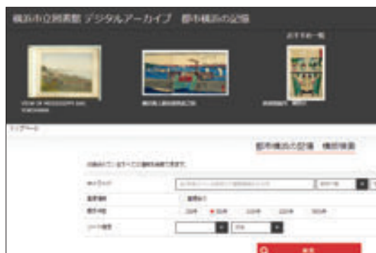
リニューアル後のデジタルアーカイブ「都市横浜の記憶」

デジタルアーカイブ「都市横浜の記憶」について、『横浜震災被害写真帖』や地域の写真などを999点登録し公開しました。また、図書館情報システムの更新に伴い、蔵書検索ページで図書と一緒に検索できる仕組みの導入やデザインなどをリニューアルし、操作性・見やすさなどの向上を図りました。さらに、IIIF(インターネット上で公開されている画像を効率的に相互利用するための国際的な枠組み)に対応した画像の提供を開始しました。