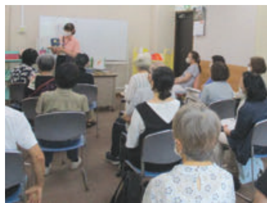
鶴見図書館 「つるみっこ絵本広場」スタッフ養成講座

(エ) 港北図書館では、「わらべうたと絵本の会」ボランティア講座の受講生による新たなおはなし会「どんぐりおはなし会」を立ち上げました。これにより、乳幼児向けおはなし会の土日開催が可能になり、より多くの親子へ読書の楽しさを伝えています。