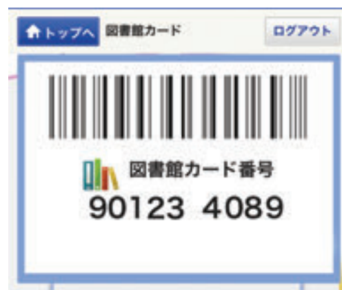
デジタル図書館カード

新たな蔵書検索ページでは、オンラインによる利用者登録サービスや、Web 書棚(検索した本や関連本を、図書館の書棚に並ぶように Web 上で表示させる)などの機能を利用できるようになりました。特に注目されるのが、デジタル図書館カードの機能です。スマートフォンを利用して蔵書検索ページにログインすると、画面上に図書館カード番号を表示できます。従来のプラスチックカードを持ち歩かなくても本を借りることが