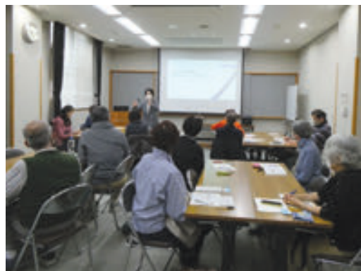
港南図書館 知って得する！図書館サービス紹介講座

第4次図書館情報システムの稼働により、蔵書検索ページも一新しました。港南、旭、山内図書館では、市民の皆様に向けた新システムの操作講座を開催しました。スマートフォンを使って、検索のコツや新しいサービスの使い方などをご紹介しますました。