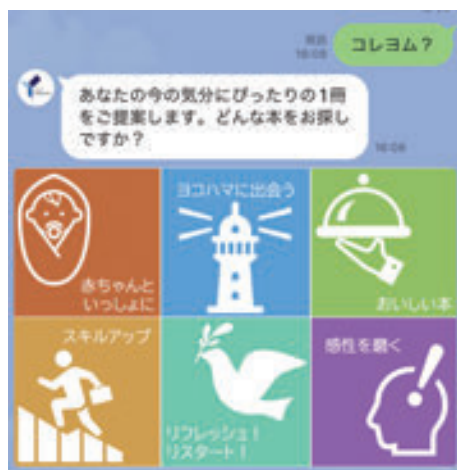
LINE での新サービス「コレヨム?」

LINE 上で利用できるユニークなサービスとしては「コレヨム?」があります。メニューから「コレヨム?」をタップすると、「赤ちゃんといっしょに」「ヨコハマに出会う」など6つのテーマが現れます。気分に合わせてテーマを選択すると、司書がおすすめするブックリストの中からランダムで1冊の本が表示されます。読書のきっかけづくりとなるサービスです。