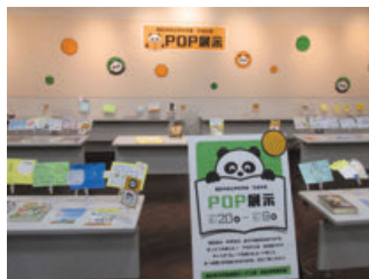
中央図書館 小・中学生のPOP展示～西区の子どものための本～