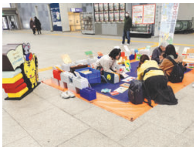
都筑図書館 みゃーごとちゅーずのおでかけ図書館