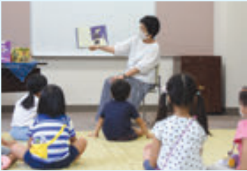
ボランティアグループによる おはなし会の様子

また、読み聞かせボランティアグループとの積極的な連携により、子ども向けおはなし会を月5～6回程度の頻度で実施するほか、ブックトークの会、大人向けのストーリーテリングを楽しむおはなし会等を開催しています。さらに、自然・環境をテーマとした活動団体等と連携し、公園での自然観察の後に、図書館で調べ学習を行う子ども向けの企画事業「森の中のプレイパーク」等を実施しており、図書館の利用促進や読書活動の推進に取り組んでいます。