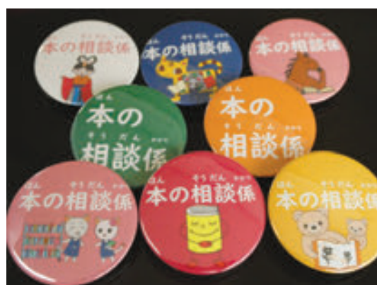
「本の相談係」バッジ