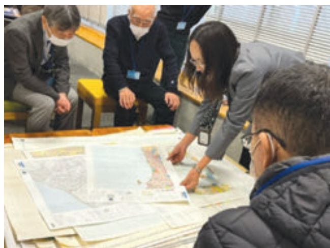
金沢図書館 大人のライブラリーツアー④ JAMSTEC