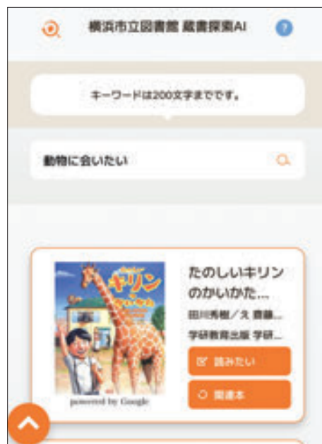
蔵書探索 AI による探索結果のイメージ