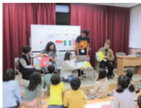
山内図書館 多言語おはなしイベント