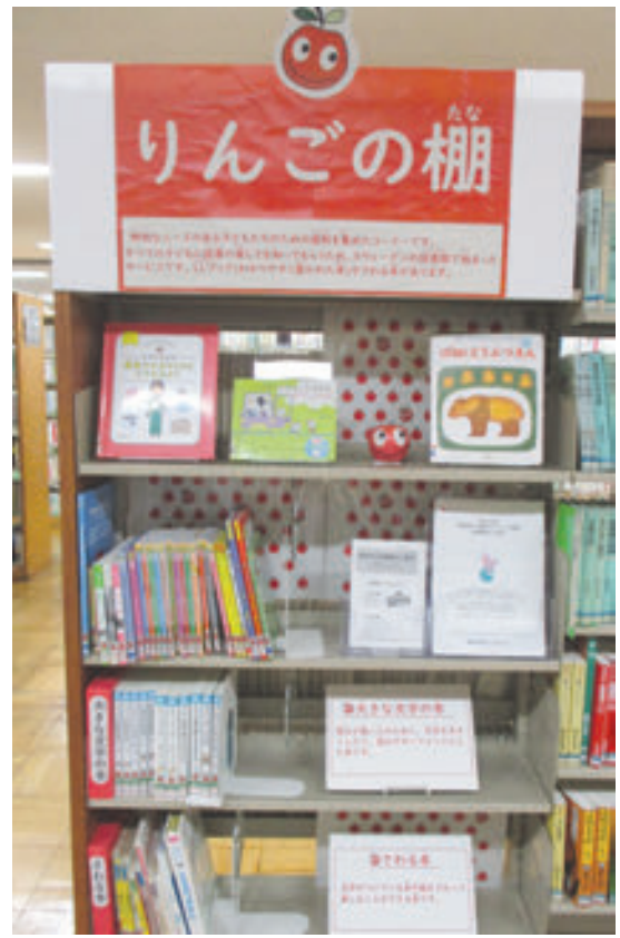
戸塚図書館 りんごの棚