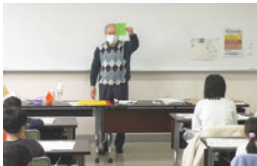
泉図書館 折り紙の世界