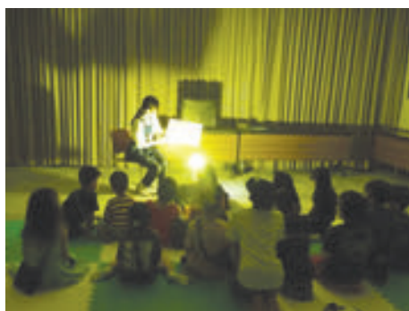
南図書館 夜のこわいおはなしの会