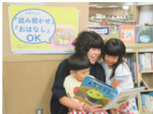
子どもの本のコーナーで読み聞かせができます (緑図書館の様子)