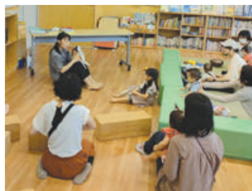
神奈川図書館 地域子育て支援拠点でのおはなし会

学校からの依頼に応じて、図書館見学、職業体験、職業インタビュー等を全館で受け入れました。司書が学校図書