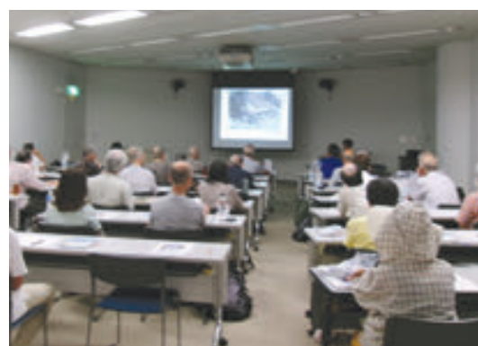
中央図書館 第2回ヨコハマライブラリースクール 「激甚化する災害に向けた横浜市の防災」