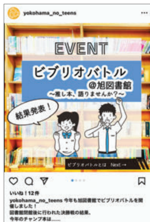
「ヨコハマノティーンズ」Instagramアカウント