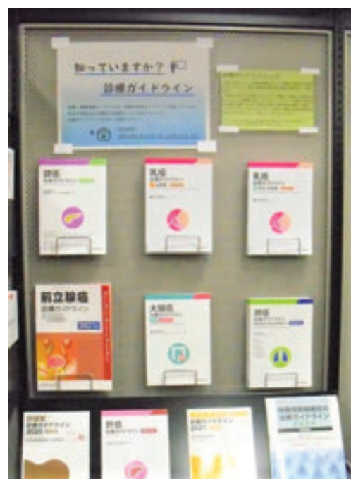
中央図書館 ミニ展示「知っていますか?診療ガイドライン」