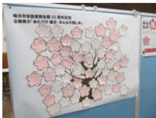
栄図書館 本のPOP展示 みんなの推し本