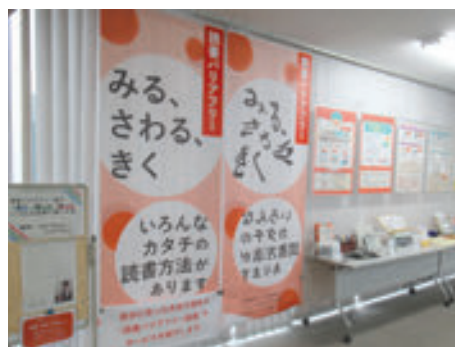
緑図書館 読書バリアフリー展示