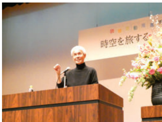
保土ケ谷図書館 講演会「時空を旅する ～チベットから江戸へ～」