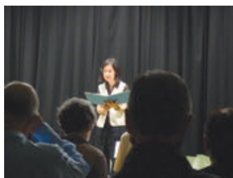
瀬谷図書館 大人のための朗読会