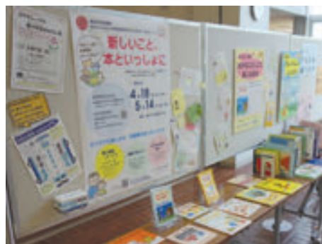
瀬谷図書館 企画展示「新しいこと、本といっしょに」