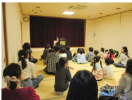
戸塚図書館 秋のこわ～いおはなし会