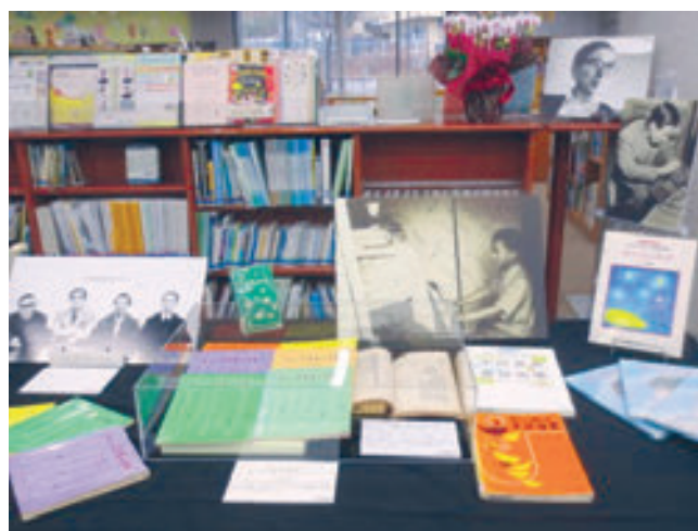
旭図書館 生誕100年 本とパネルでめぐる中田喜直展