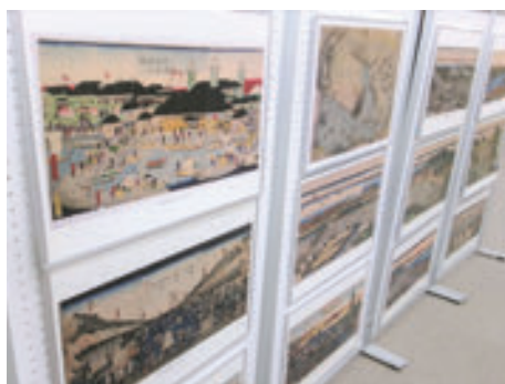
中図書館 開国開港期貴重資料パネル展