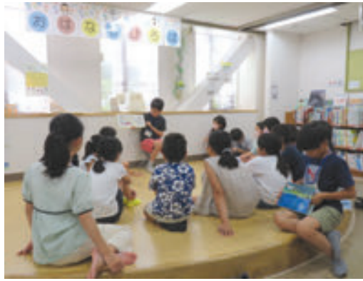
港北図書館 子ども司書講座