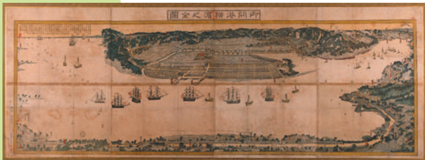
【御開港横浜之全図(玉蘭齋橋本謙〔万延元年〕)】