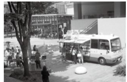
【移動図書館 みなとみらいステーション（西区）】

また、市民意見募集では、身近な場所で図書館サービスを利用したい、という声も数多くいただきました。こうしたご意見を反映し、「移動図書館」や「図書取次サービス」の拡充も図ってまいります。令和元年6月にいわゆる「読書バリアフリー法」も施行されました。この趣旨等をも踏まえ、横浜市立図書館は、「誰もが利用しやすい図書館」を目指してまいります。