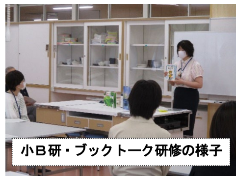
小B研・ブックトーク研修の様子

校内研修や研究会などの研修に、司書を講師として派遣します。ブックトークや絵本の読み聞かせの実演、講義なども行います。