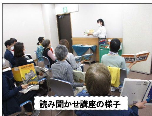
読み聞かせ講座の様子