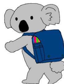
金沢図書館 マスコットキャラクター 金沢リード