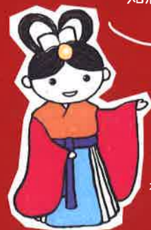
神奈川図書館キャラクター 「乙姫 かなちゃん」